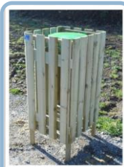
La poubelle P.3