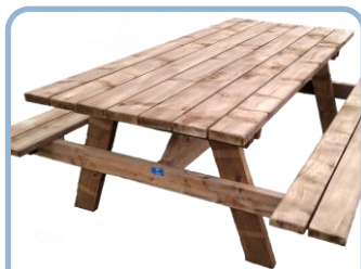
Les tables-bancs P.3