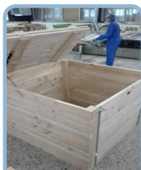
Le bac à compost P.6