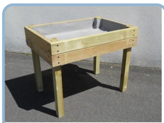
Le jardin à hauteur P.5