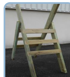
L'escabeau de clôture P.5