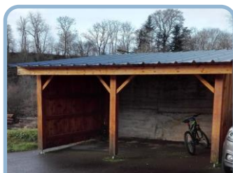
L'abri de bus P.4