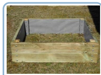
Le bac pour jardinage..Page 5 P.5