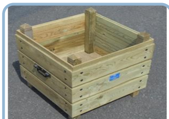
La jardinière Sanadoire P.5