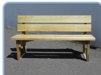
Les bancs P.4