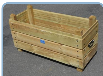
La jardinière Sancy P.5